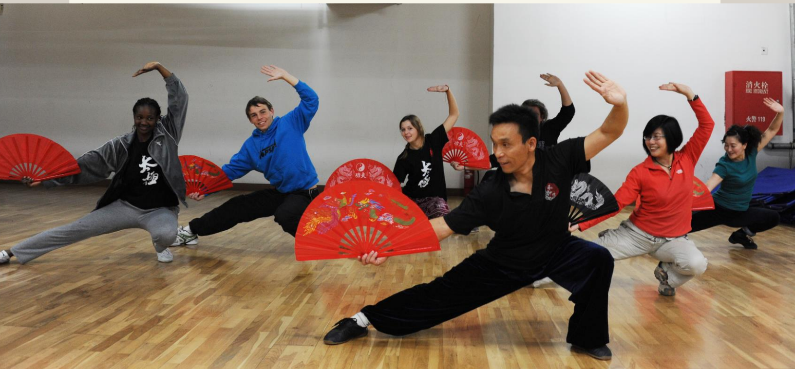
中国政法大学港澳台教育中心 Education Center of Hong Kong, Macau and Taiwan Students, CUPL