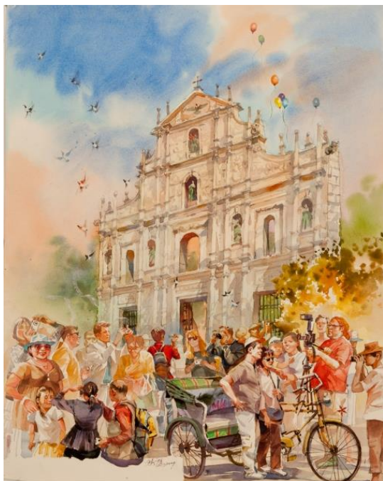
3, 澳门著名景点——大三巴。(姚丰作) 4, 妈阁紫烟。(李志荣作)